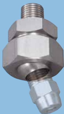
※照片是在UT上安装喷雾喷嘴