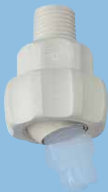
※照片是在UT上安装喷雾喷嘴